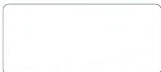
シルバーグレー (NW・NS)